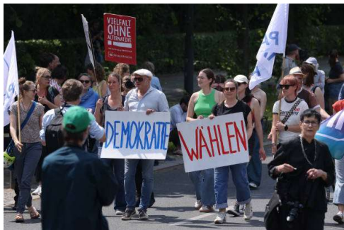
Demonstration gegen Rechtsextremismus, Berlin, Juni 2024

Während sich Gesellschaften heute ihrer eigenen demokratischen Rechte viel bewusster sind als früher, ist es offensichtlich, dass demokratische Regierungen nie alle Bürger:innen zufriedenstellen können (Rauscher 2017). Sie ist eine imperfekte, aber die bisher bestmögliche Form des Volkes, sich selbst zu regieren (Merkel 2024).