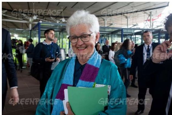
Eine der Klägerinnen des Vereins Klimaseniorinnen bei der Urteilsverkündung, 9. April 2024

Ein Verständnis von Demokratie, das auf Mehrheitsentscheidungen, und nicht auf Konsensentscheidungen beruht, kann also zu Menschenrechtsverletzungen führen. Mehrheits- und Konsensdemokratie sind grundsätzlich gegensätzliche Demokratiekonzepte. Erstere konzentriert sich auf die Mehrheitsregel, letztere auf ein ausgedehntes System der gegenseitigen Kontrollen. Während die Konsensdemokratie daher mehrere Strukturen von „Vetopunkten“ hervorhebt, die das Handeln von Regierungen einschränken (z. B. starke zweite Kammer, Koalitionen, Verfassungsgerichte), bevorzugt der idealtypische Aufbau von Mehrheitsdemokratien Strukturen mit geringeren Kontrollfähigkeiten. Die Konsensdemokratie kann auch als eine konstitutionelle Demokratie verstanden werden, deren Kernelement ein starkes Verfassungsgericht ist (Schlenkrich & Schlenkrich 2020).